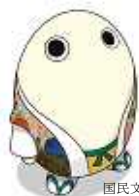
国民文化祭・京都2011 マスコットキャラクター